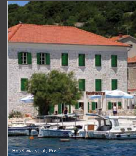
Hotel Maestral, Prvić